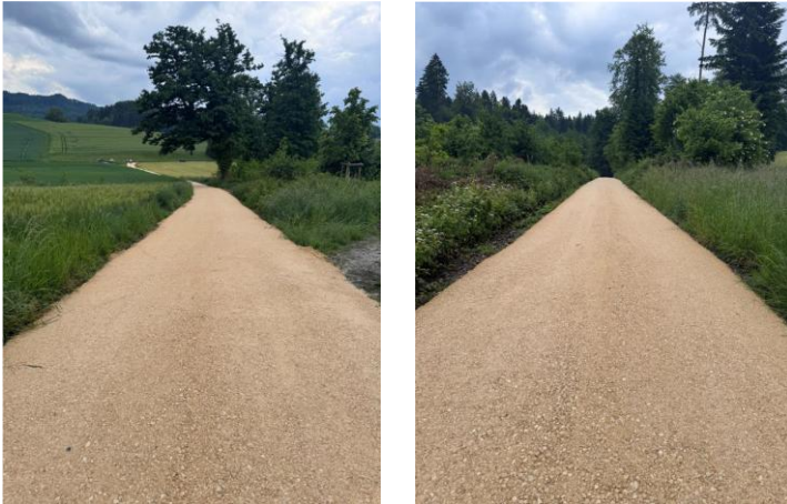
Strassenunterhalt im Maiächerli

Im Maiächerli ist in der Schutzzone die Verschleisssschicht erneuert worden. Die Auflagen in den Schutz zonen sind eingehalten worden.