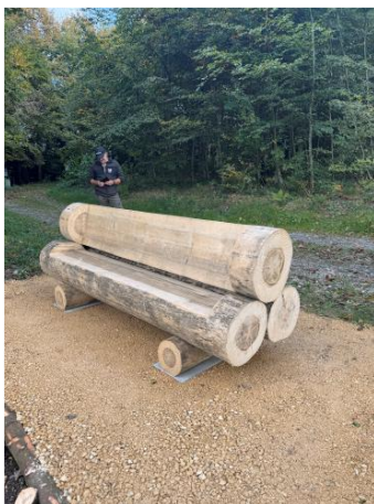
Bank im Chüerain

Bei den sieben Grillplätzen und den zwei Waldsofas ist der Baumbestand auf Stabilität, Krankheiten und herunterfallende Äste kontrolliert worden.